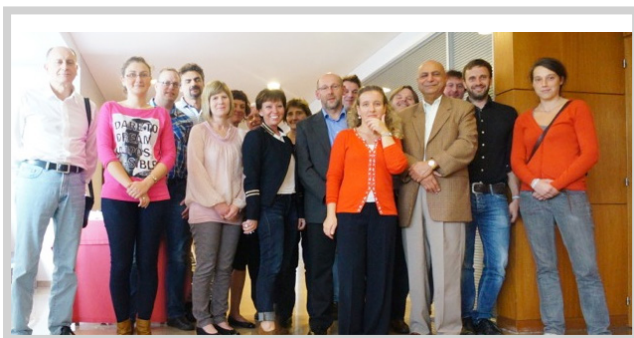
Projekttreffen in Lissabon, Portugal - Oktober 2013

Im Oktober 2013 fand unser drittes Projekttreffen mit allen Partnerländern in Lissabon, Portugal, statt. Auf dem Treffen wurde die erste englische Draft Version des E-Portals Eucapo www.eucapo.eu von dem Partner Mandarin präsentiert. Die meisten Masseur- und Physiotherapeutberufe der teilnehmenden Länder für das englische Anerkennungs-